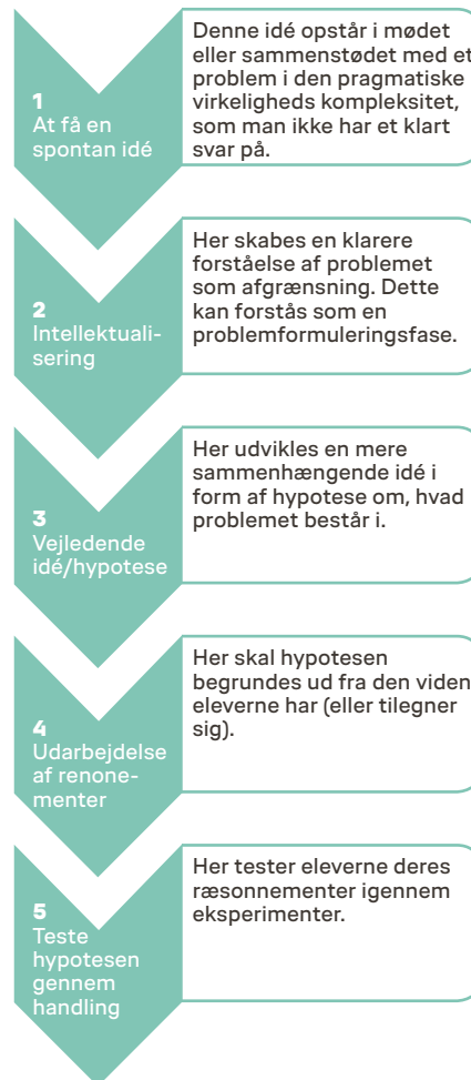
Figur 2. Den eksperimenterende undervisning i faser.

Deweys eksperimenterende undervisning er ikke forbundet med dannelse i klassisk forstand, men Dewey forbinder på sit pragmatiske grundlag læring med at være en demokratisk borger, da læring handler om at tilegne sig den viden, man har brug for for at deltage i et demokratisk fællesskab. I den forstand udgør det praksisnære og anvendelsesorienterede hos Dewey en forbindelse mellem fag og verden, ligesom hos Klafki, men Dewey forholder sig dog ikke, som Klafki, til den personlige myndiggørelse af eleverne.